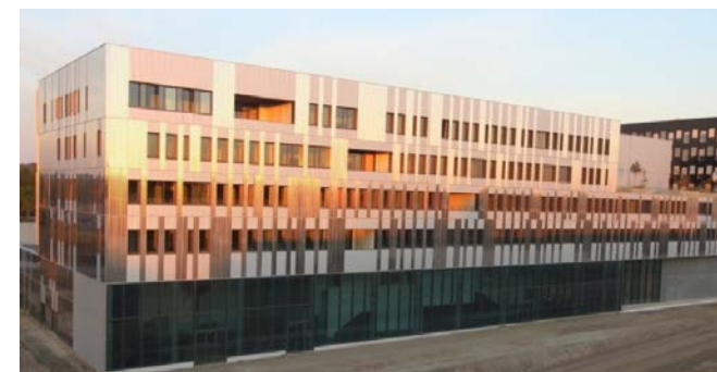
Maison de la Formation Jacqueline Auriol à Toulouse