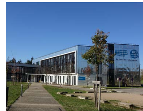
IUT Lumière Lyon 2