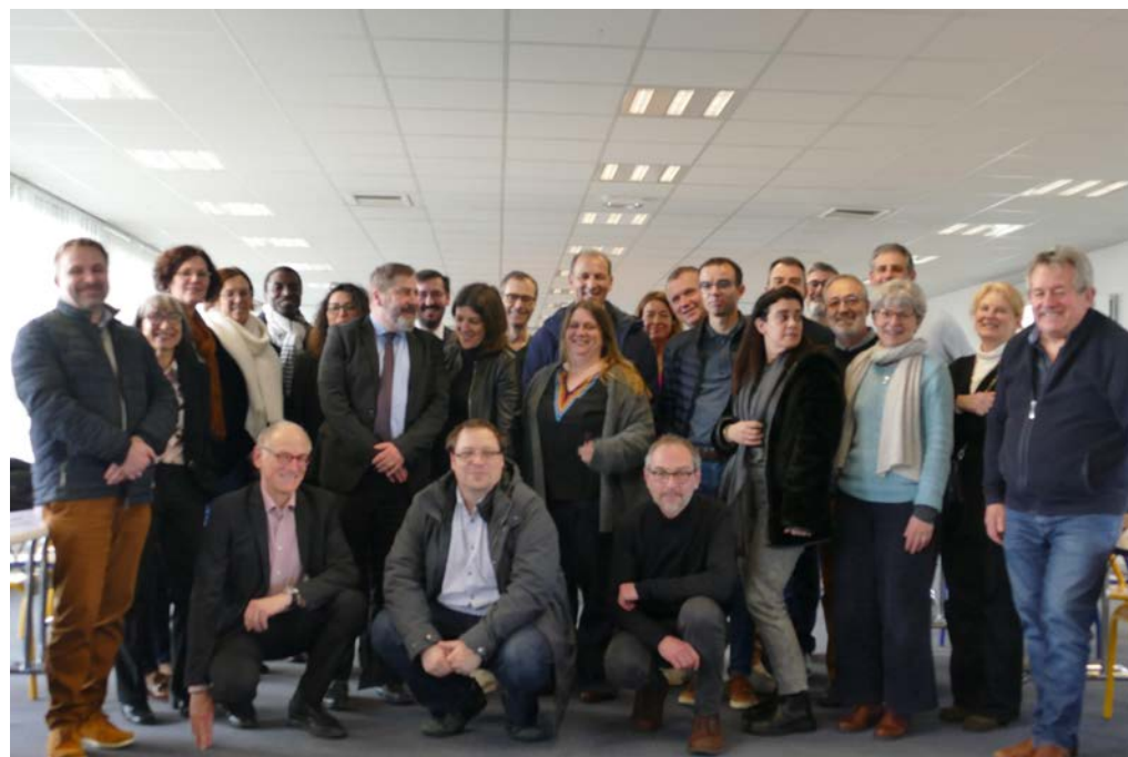
Séminaire ADIUT nouveaux Directeurs - 08.02.2024 -